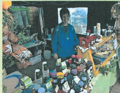
Die Auswahl an heimischen Köstlichkeiten ist riesig.

Veranstalter: Landkreis Waldeck-Frankenberg, Fachdienst Landwirtschaft, Korbach, Dezernat Verbraucherschutz und Direktvermarktung, mit Unterstützung von: Gemeinde Edertal, Sparkasse Waldeck-Frankenberg. Präsentiert wird der Markt von der Waldeckischen Landeszeitung/Frankfurter Zeitung.