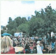
... und viele Menschen erwartet.

Bei Verbrauchern ist es heute angesagt, sensibel mit dem Thema Essen und Trinken umzugehen, ja, bewusster einzukaufen. Der „Markt am See“ begegnet diesem Trend, gibt ein gutes Stück Transparenz und informiert über die Herstellung sowie den Vertrieb von regionalen Produkten.