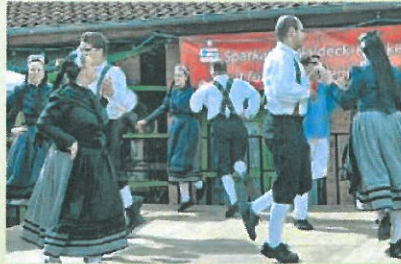
Volkstänze setzen stimmungsvolle Akzente.

HEMFURTH-EDERSEE. (ros/r). Schlendern, Staunen, Probieren und Genießen heißt es auf dem „Markt am See“ am Muttertag, 11. Mai, von 11 bis 18 Uhr auf dem Spermauer-Vorplatz. „Total Regional“ heißt das Motto der Direktvermarkter und Kunsthandwerker. Über 100 Aussteller bieten ihre vielfältigen Produkte an und geben dabei interessante Einblicke in die Erzeugung und Verarbeitung.