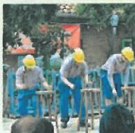
Lustige Spiele ...