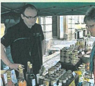
Viele leckere Spezialitäten aus der Region.

An 115 Ständen locken sehr vielseitige Köstlichkeiten aus der Region – Hausmacher-Wurst, Krustenbraten, Lammfleisch, Flammkuchen, Scherperlinge, Ziegenkäse, Räucherfisch, Eis – die Auswahl ist riesig. Viele der Produkte gibt es auch zum Mitnehmen: etwa Holzofenbrot, Honig, Fruchtaufstriche, Liköre, Antipasti, Senf, Käse, Nudeln, Gemüse, Milchprodukte, Säfte, Weine, Liköre und vieles mehr. Und wer noch den eigenen Garten bepflanzen will, findet Beet- und Balkonpflanzen und Kräuter im Angebot.